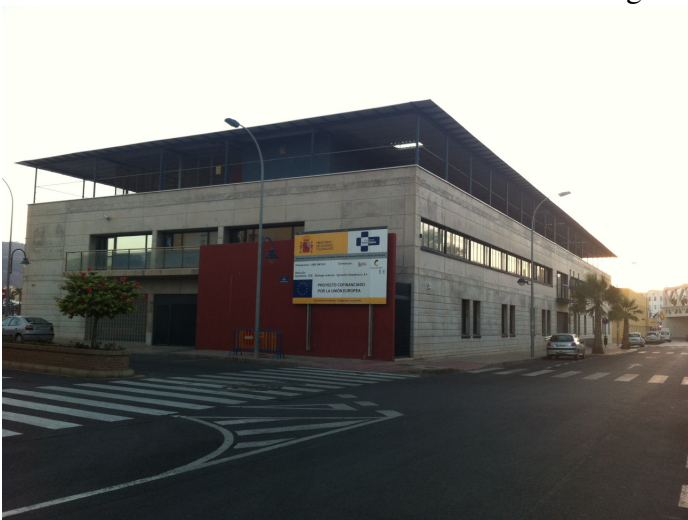
Fotografía auxiliar de conjunto