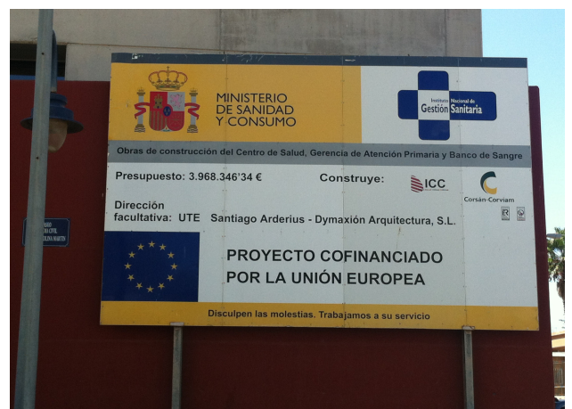
Fotografía auxiliar de detalle